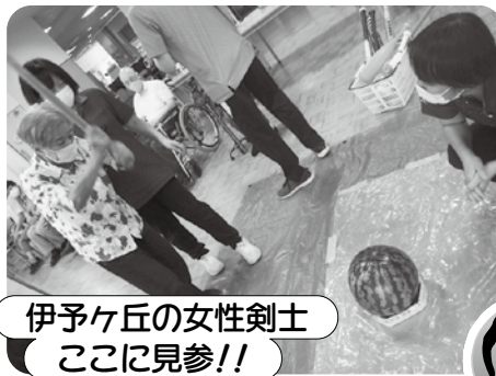
伊予ヶ丘の女性剣士 ここに見参!! はたしてスイカの行方は...