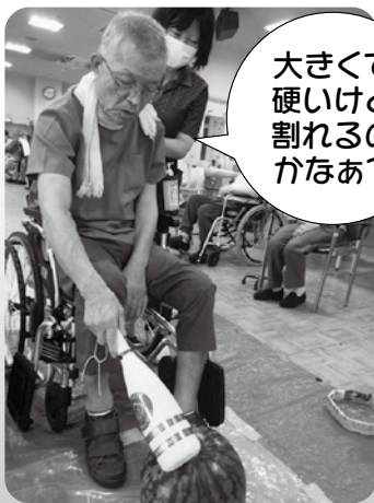
大きくて 硬いけど 割れるの かなあ?