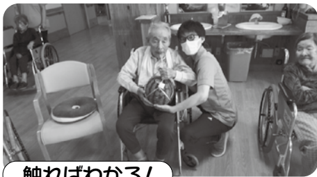
触ればわかる! このスイカは身の詰まった 良いスイカだ!