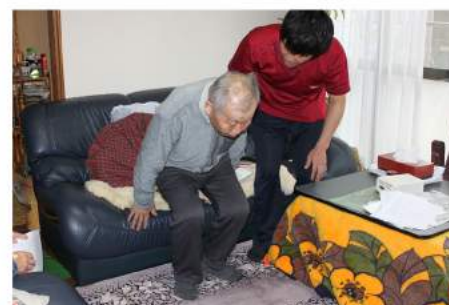
立ち上がり・座り動作