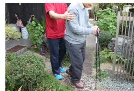
自宅周辺の歩行練習